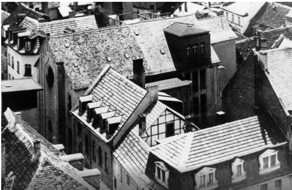
De synagoge van Fulda na de renovatie en uitbreiding in 1927, in 1938 in brand gestoken.