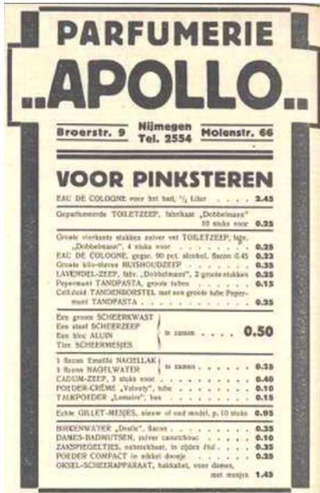
Advertentie in de Provinciale Gelderse Nijmeegse Courant van 18 mei 1934.