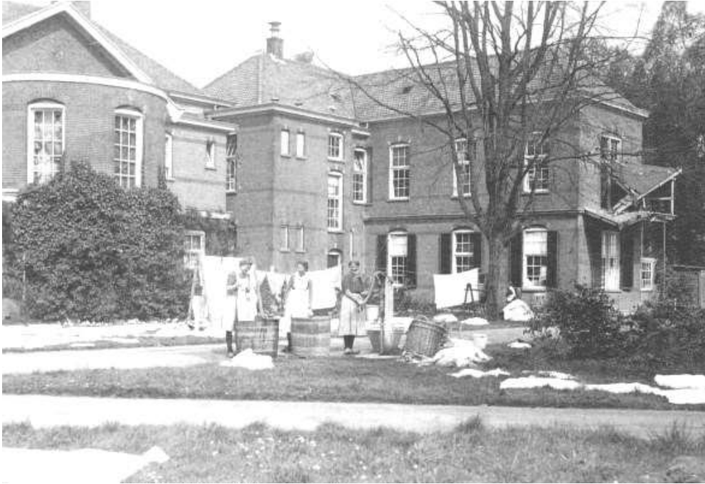
Psychiatrische instelling Warnsveld in de Tweede Wereldoorlog. Foto Wandelzoekpagina Zutphen

Bron: Regionaal Archief Zutphen, Inventaris van het archief van de gemeente Zutphen (1920-1980), nummer toegang 0003, inv.nr. 2292. Hier worden de zes personen genoemd.